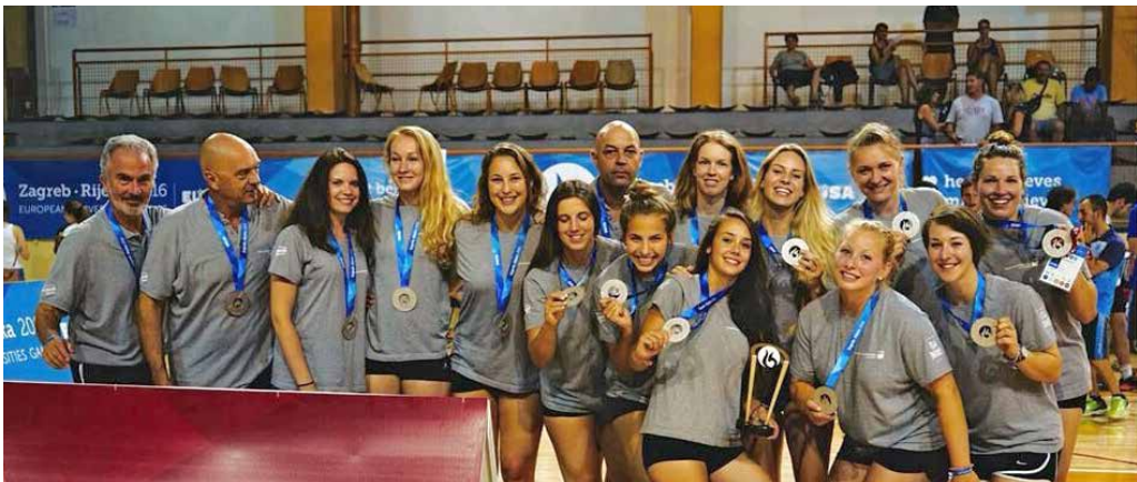
L'équipe UNIL-EPFL de volley, vice-championne d'Europe universitaire aux EUSA Games de Zagreb