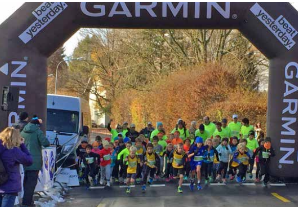
Départ de la course Forcethon Talent