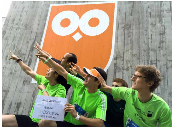
Vainqueurs de la RUN24Dorigny 2016